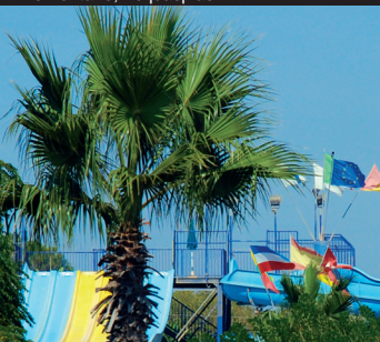
Tre Fontane, Acquasplash

Puzziteddu , entre Capo Granitola et la falaise pittoresque dont il tire son nom, est l'endroit de prédilection des surfeurs et windsurfers, lieu idéal pour les vents et courants d'air qui s'y développent. On trouve des piscines et terrains de foot auprès de structures réceptives privées.