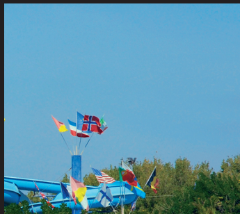
Tre Fontane, lido